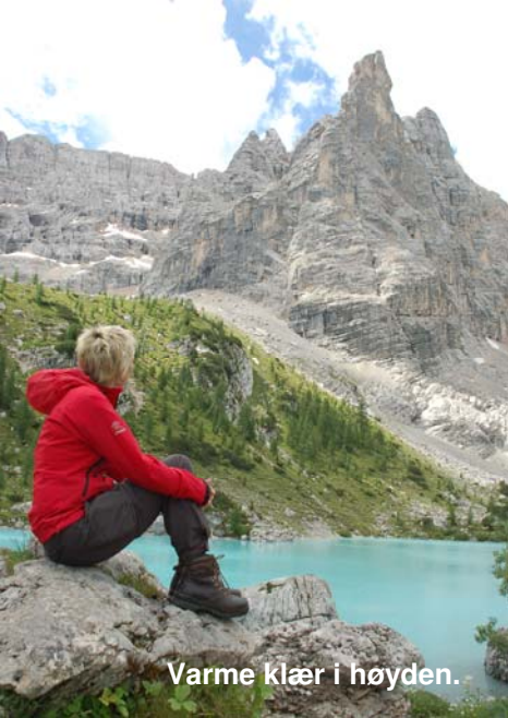
Varme klær i høyden.