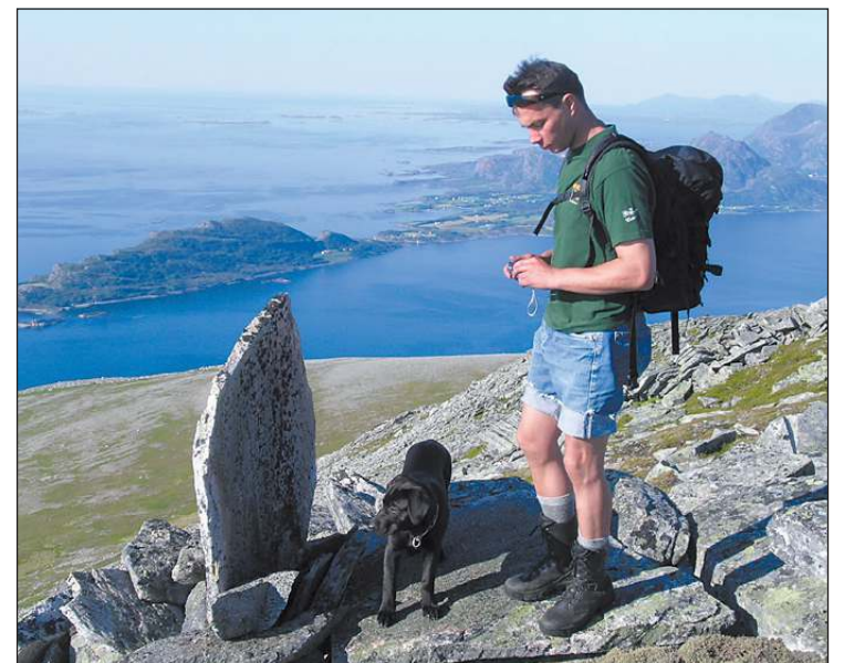
PRAKTFULL UTSIKT: Fra Hellandshornet i Haram har du praktfull utsikt over Miffjorden mot Midsund, Otrøya og det øvrige øyriket nord om Sunnmøre.