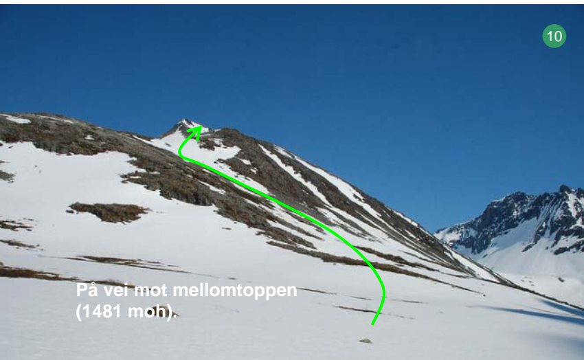
På vei mot mellomtoppen (1481 moh).

Løypa går noen hundre meter under varden på 1481-toppen. Her flater løypa ut et kort stykke. Nå skal vi krysse en bratt skråning, omtrent ved pila på bildet over. Etter skråningen ser vi hovedtoppen (11). Vi følger ryggen til toppen. For retur, følg toppryggen nedover og ta så den brede bakken ned mot Gjølbotnen, som illustrert med den blå pila på bilde 11.