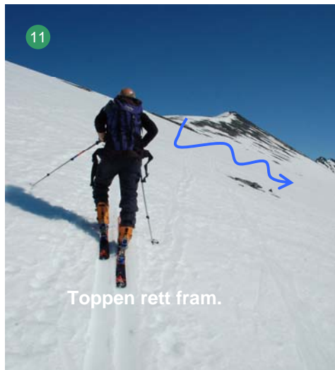
Toppen rett fram.