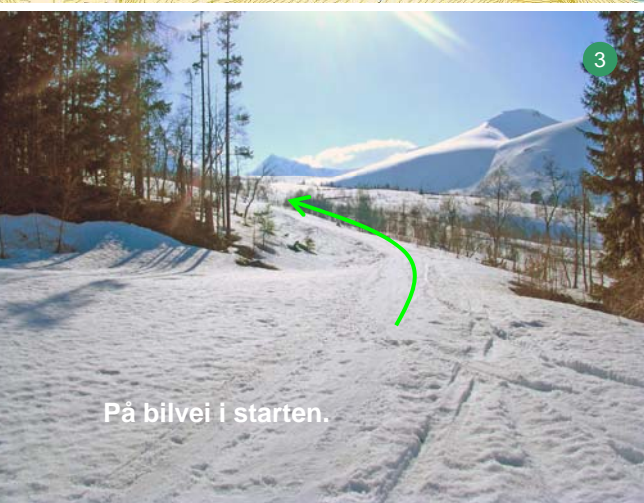
På bilvei i starten.