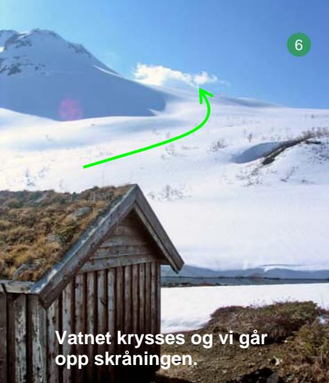
Vatnet krysses og vi går opp skråningen.