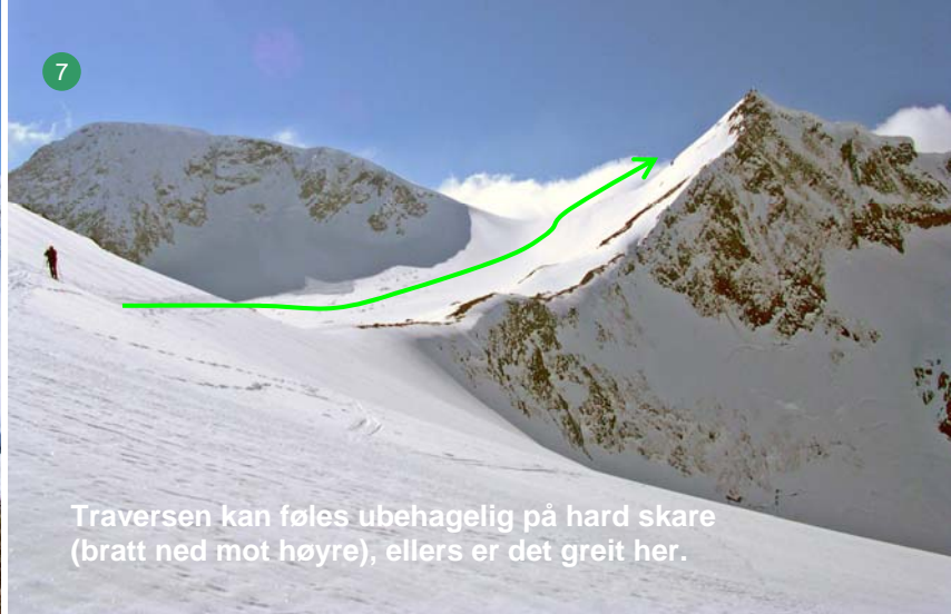
Traversen kan føles ubehagelig på hard skare (bratt ned mot høyre), ellers er det greit her.

Fra Månvatnet går vi som vist på bilde 6. Vel oppe på kanten kommer traversen vist på bilde 7. Kryss skråningen og ta så inn i dalen mellom Storbua (til venstre) og Kvassetind (til høyre). Merk at det kan gå ras fra Storbua, derfor holder vi oss til høyre (inn mot Kvassetind).