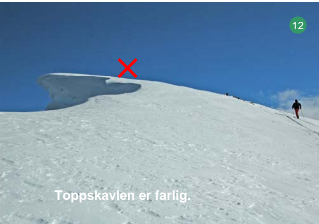
Toppskavlen er farlig.