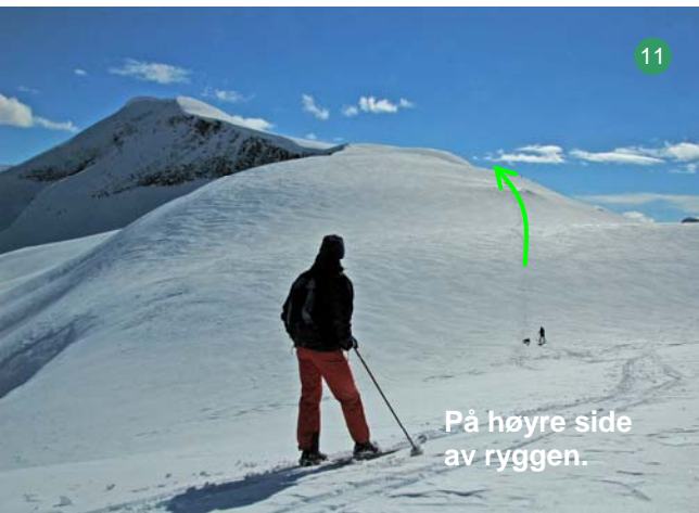
På høyre side av ryggen.