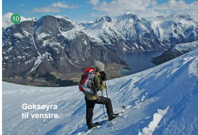
Goksøyra til venstre.