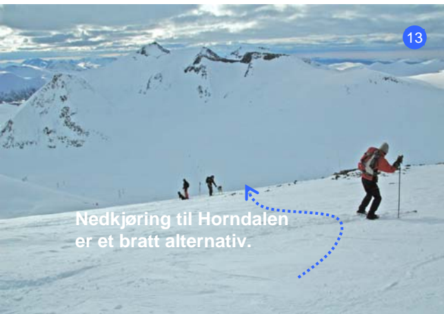
Nedkjøring til Horndalen er et bratt alternativ.

Oppe på Uglehaugen ser du ruta innover ryggen (8). Turen videre går opp og ned i svinger innover denne brede ryggen. Flott utsikt.