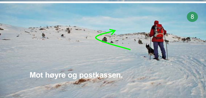
Mot høyre og postkassen.