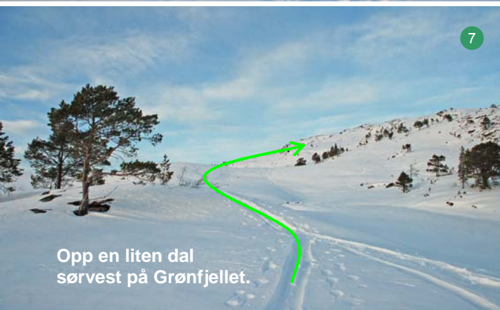
Opp en liten dal sørvest på Grønfjellet.