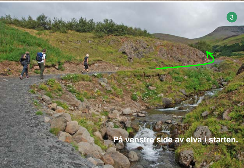
På venstre side av elva i starten.