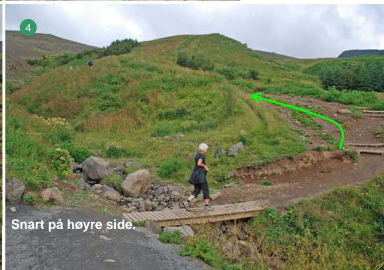
Snart på høyre side.