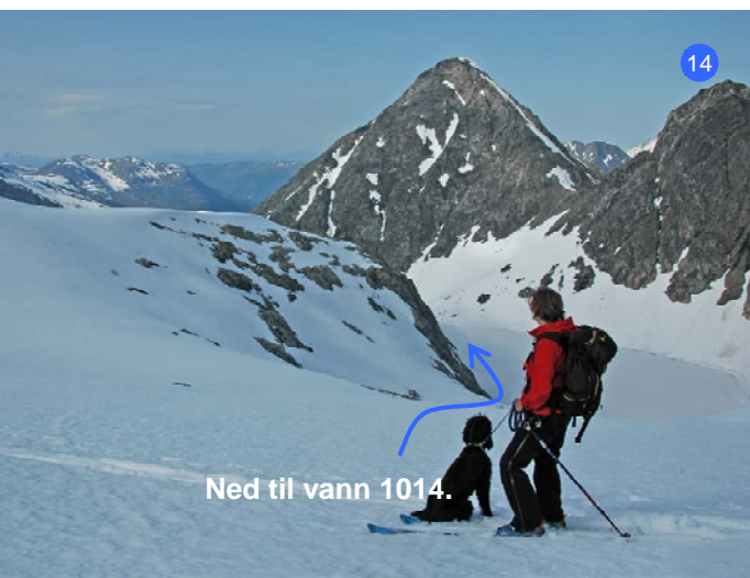
Ned til vann 1014.

På retur velger de fleste å kjøre den bratte dalen ned til vann 1014 (14 og 15) i stedet for å følge ryggen der en kom opp. Kryss vannet. Du møter snart dine spor fra oppturen. Ellers er det samme vei ned som opp.