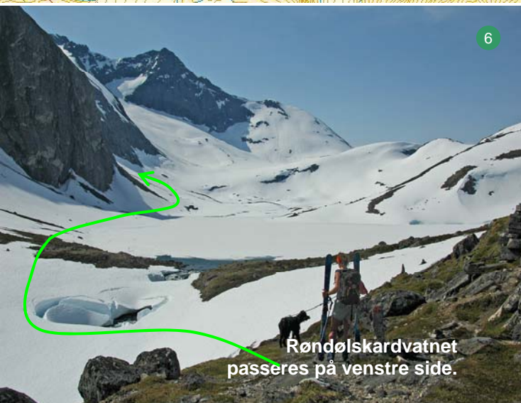
Røndølskardvatnet passeres på venstre side.