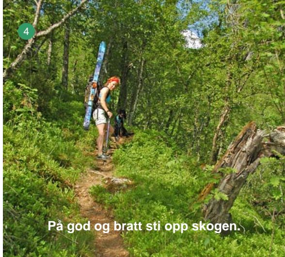
På god og bratt sti opp skogen.