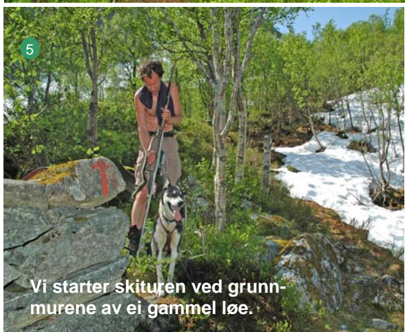
Vi starter skituren ved grunnmurene av ei gammel løe.