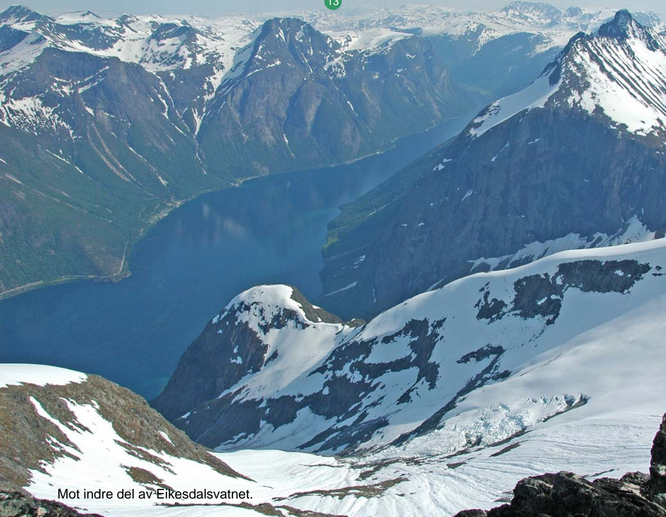
Mot indre del av Eikesdalsvatnet.

Utsikten fra den luftige toppen er formidabel (13).