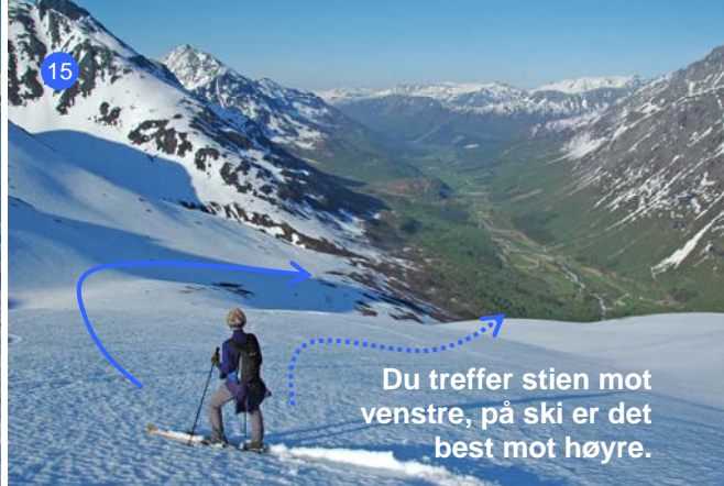
Du treffer stien mot venstre, på ski er det best mot høyre.

Retur samme vei som opp (14). Den første og siste bakken er meget bratt. Ellers er det ingen spesielle forhold med unntak av at du skal ned 1500 høydemeter - som er vanvittig mye nedoverbakke.