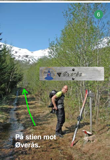
På stien mot Øverås.