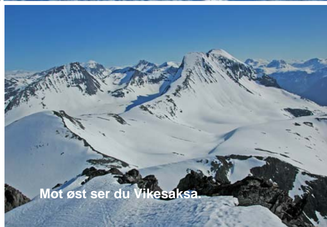
Mot øst ser du Vikesaksa

Litt etter Saufjellet må du velge om du skal følge stien eller å kjøre på ski hele veien (15, stiplet strek på kartet).