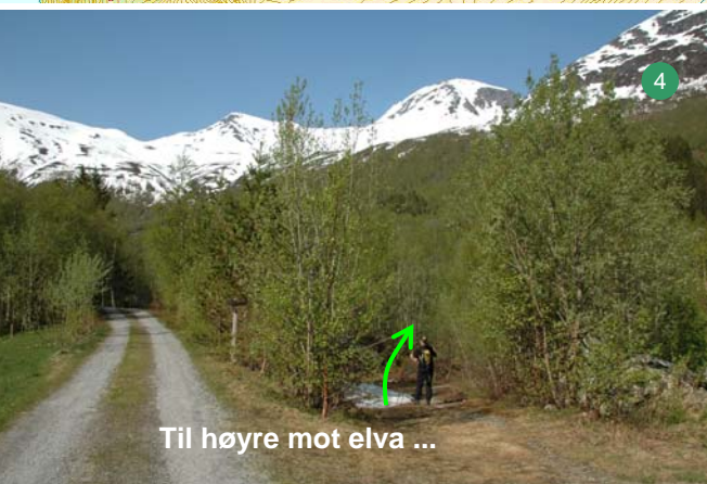
Til høyre mot elva ...