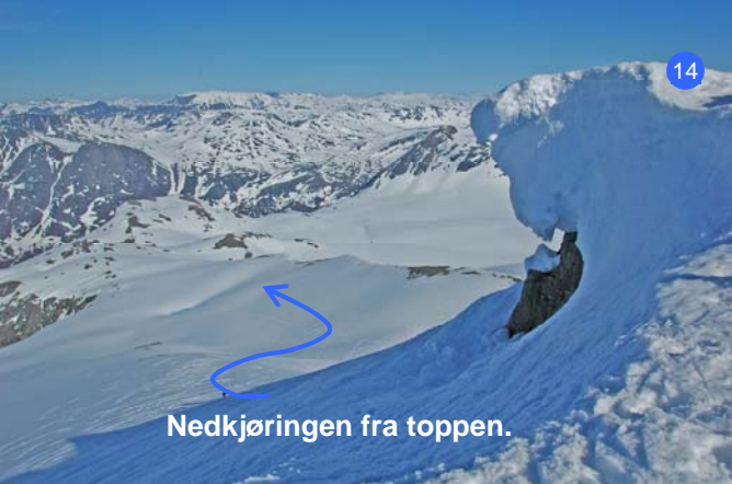
Nedkjøringen fra toppen.