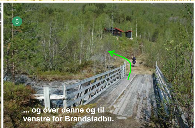
... og over denne og til venstre for Brandstadbu.