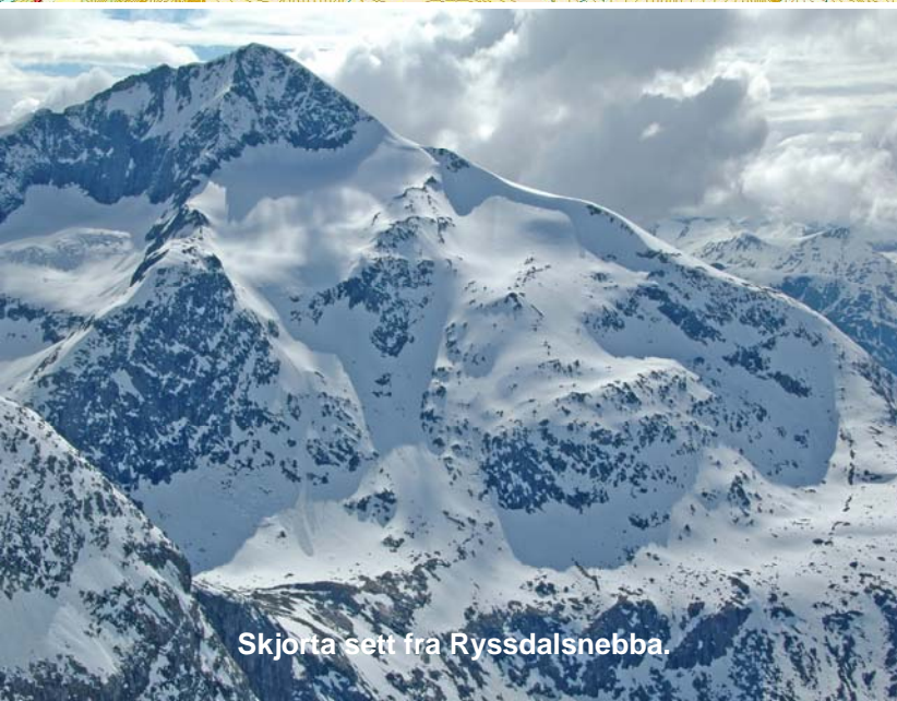
Skjorta sett fra Ryssdalsnebb.

I starten går du samme rute som til Ryssdalsnebb. I Kanndalen ved Storstølen treffer du skiltet til Frusalbotnen og Skjorta. Her tar du ned til høyre (1). I bunnen av dalen går det ei solid bru over elva (2). Etter denne stiger du opp og dreier etter hvert mot høyre - uten at du kommer for nær skavlene over.