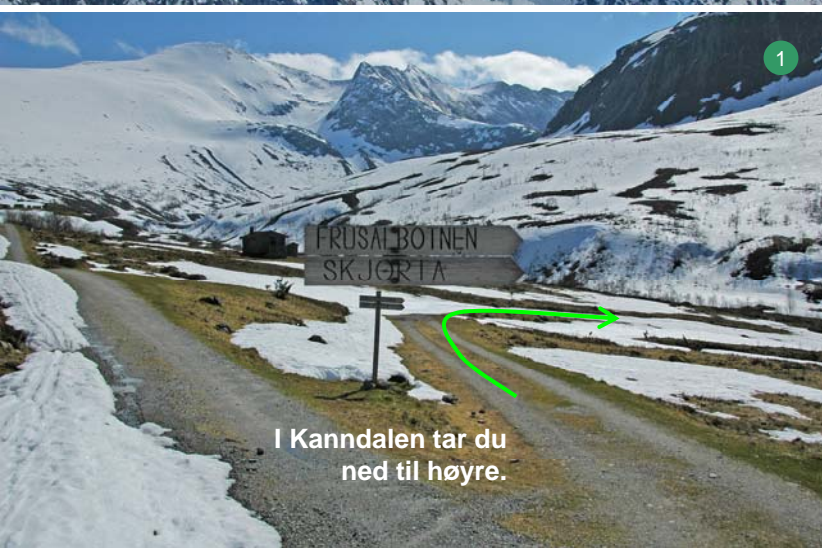
I Kanndalen tar du ned til høyre.

Utdrag fra Skibok for Romsdal. Du finner den i bokhandelen. Den kan også bestilles på www.turbok.no .