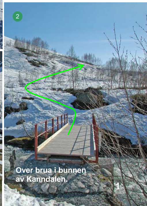
Over brua i bunnen av Kanndalen.