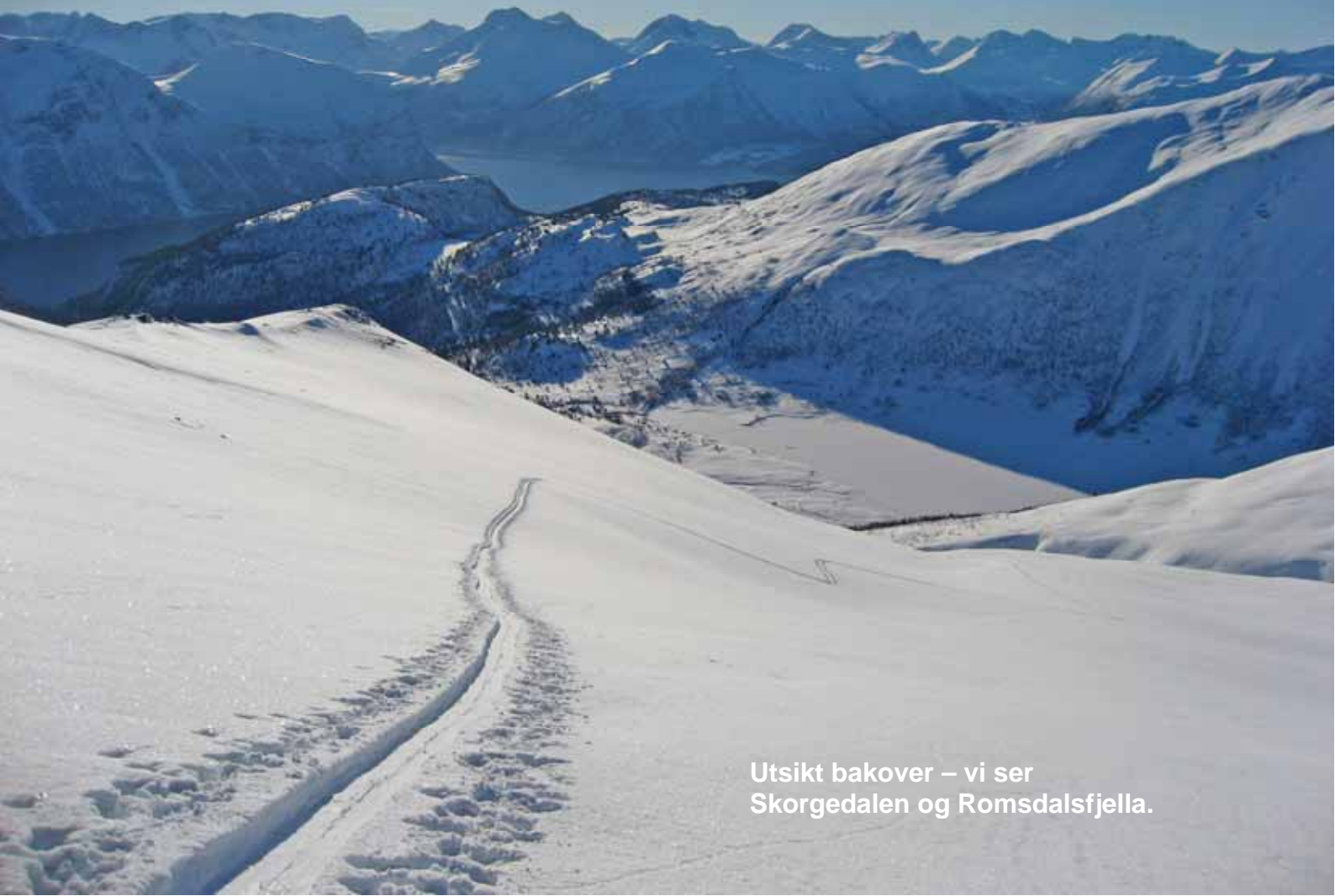
Utsikt bakover – vi ser Skorgedalen og Romsdalsfjella.

Etter at vi er gjennom skogen går turen inn i botnen (4). Vi skal nå opp skråningen mot høyre. Her har vi flott utsikt bakover (5). Lenger oppe får vi valget mellom Nebba til venstre og Smørbottentind (høyest) mot høyre (6).