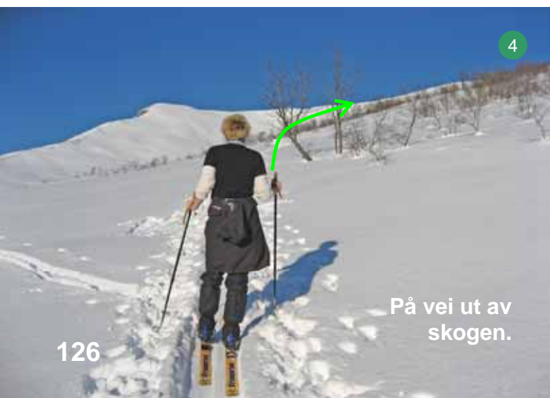
På vei ut av skogen.