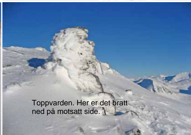
Toppvarden. Her er det bratt ned på motsatt side.