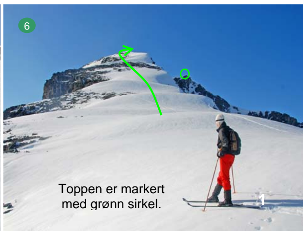
Toppen er markert med grønn sirkel.