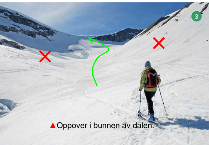
▲ Oppover i bunnen av dalen.

▲ Fortsett opp i bunnen av dalen. Her er det tryggest. Det kan komme ras både fra høyre og venstre side. Mot slutten av dalen tar du retning mot den store fjellveggen og svinger så til venstre for denne (4). Gå opp kanten til ryggen (5). Dette er turens bratteste parti. Fra ryggen har du flott utsikt vestover. Nå dreier du til høyre og går opp ryggen mot toppen (6).