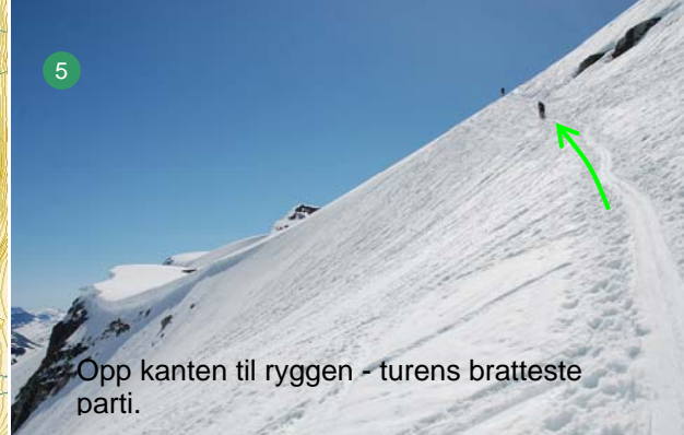
Opp kanten til ryggen - turens bratteste parti.