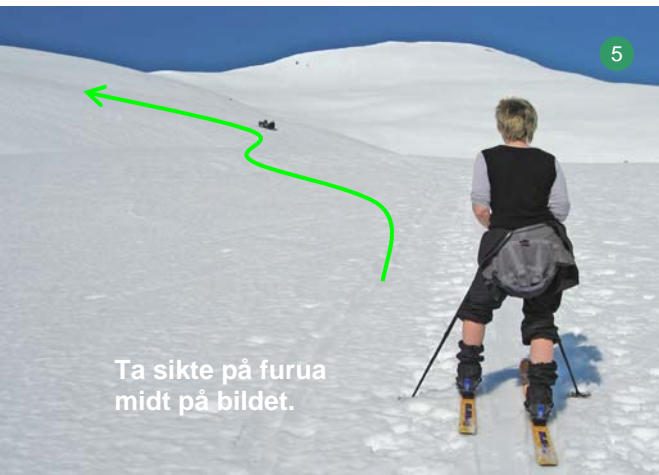
Ta sikte på furua midt på bildet.