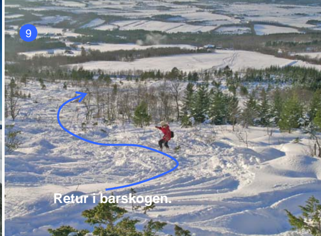
Retur i barskogen.

Terrenget er jevnt bratt, men flater ut like før toppen (7). Vær oppmerksom på den store skavlen mot øst. Returen tas samme veien som du kom opp. Her er gode forhold for telemarkkjøring (8). Er føret bra kan du ta en avstikker til høyde 510 (8), men pass på at du holder høyden ut mot høyre slik at du treffer sporet før det går ned gjennom granskogen.