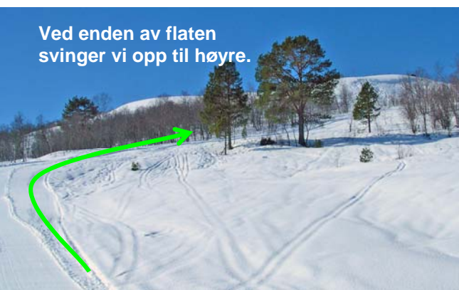
Ved enden av flaten svinger vi opp til høyre.