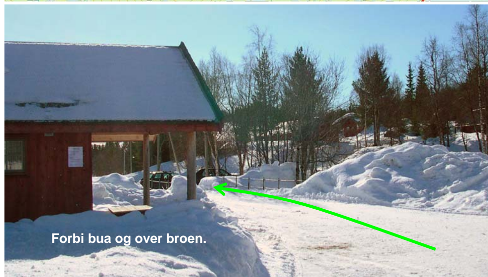
Forbi bua og over broen.