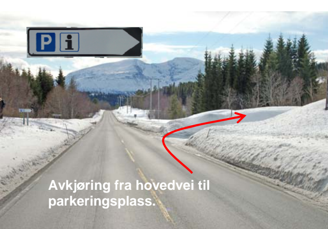
Avkjøring fra hovedvei til parkeringsplass.