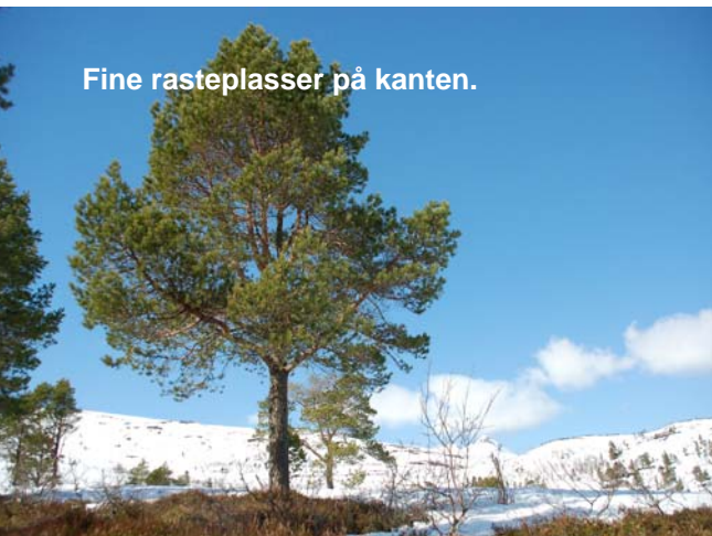
Fine rasteplasser på kanten.