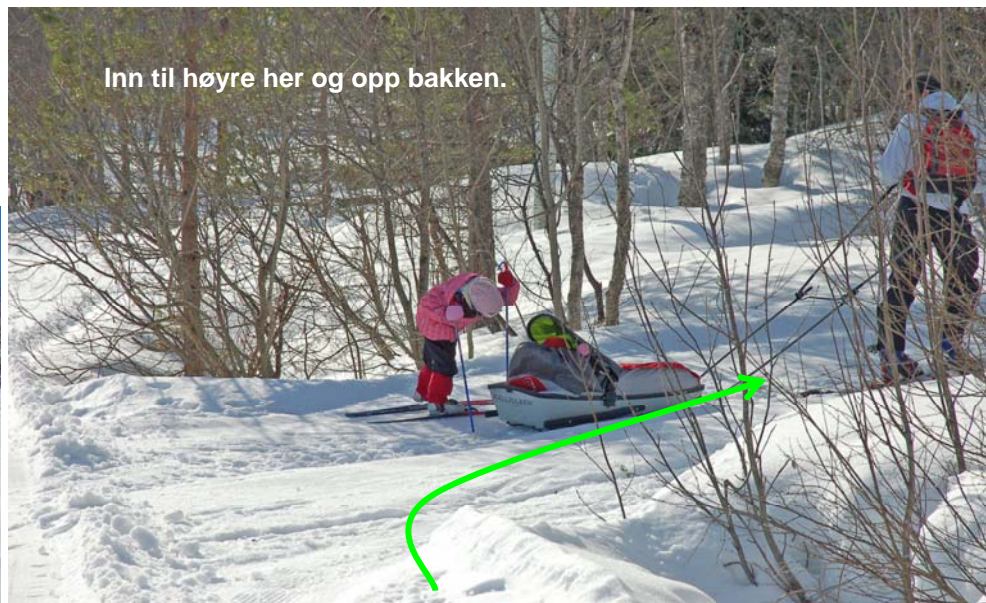
Inn til høyre her og opp bakken.