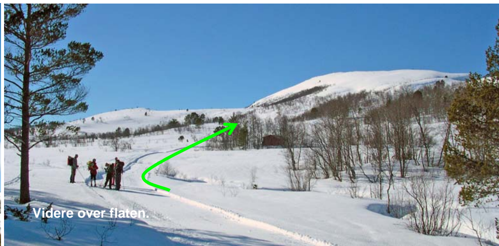
Videre over flaten.