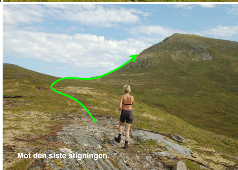
Mot den siste stigningen.