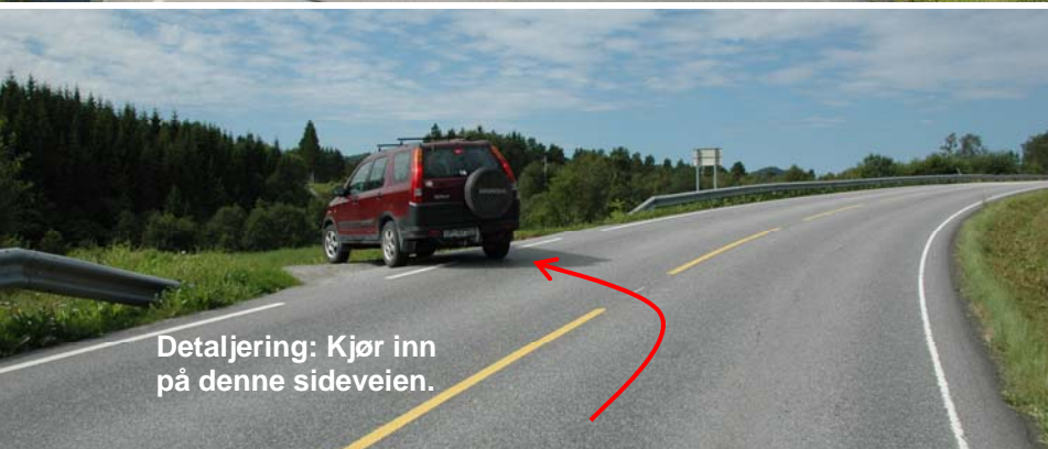
Detaljering: Kjør inn på denne sideveien.