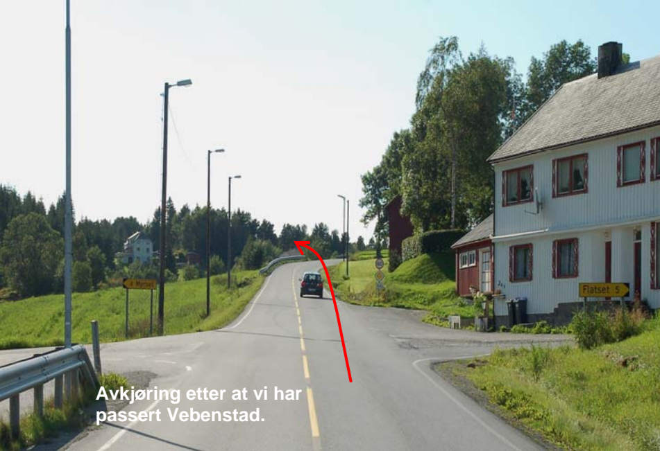
Avkjøring etter at vi har passert Vevenstad.