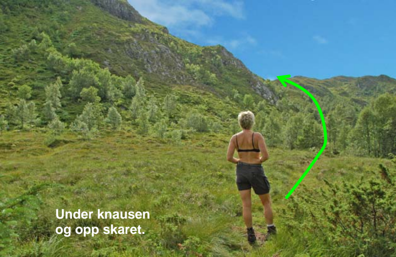
Under knausen og opp skaret.