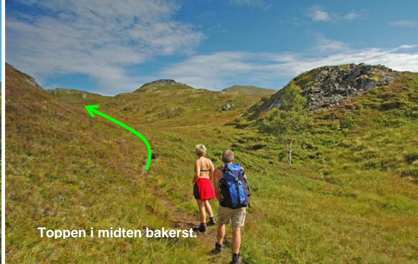
Toppen i midten bakerst.

Oppe i høyden ender dalen på en flate. Stien krysser over til venstre side. Der legger den seg tett inntil en knaus (bildet over til venstre). Etter knausen svinger stien til venstre (mot øst) og stiger opp gjennom et skar der du etter hvert får se toppen bak noen lave høyder (bildet øverst til høyre). Følg stien over høydene og til skaret til venstre for toppen (bildet til høyre). Den siste bakken er bratt og tung, men det er grei sti her.