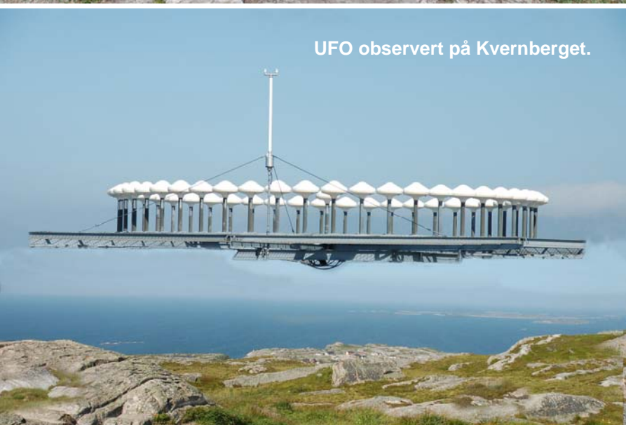
UFO observert på Kvernberget.