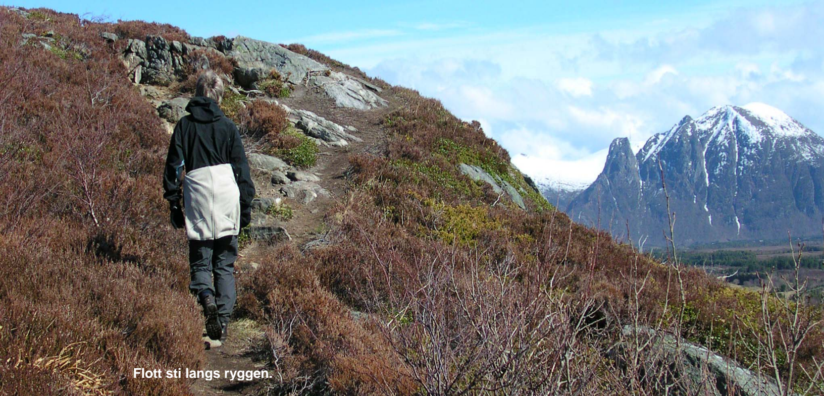
Flott sti langs ryggen.