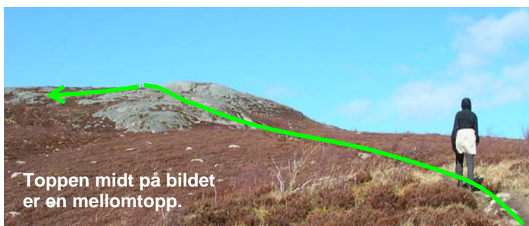
Toppen midt på bildet er en mellomtopp.

God sti videre oppover til første toppen vist på bildet over. Herfra går vi videre mot toppen med masten, slik som pilen viser. På returen kan vi, etter at vi har kommet ned svabergene på bildet under, ta stien rett ned dalen, mot vannverkshuset.