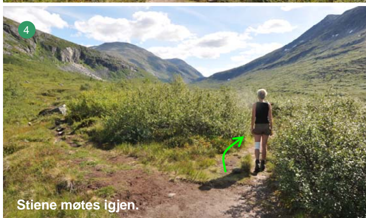
4 Stiene møtes igjen.