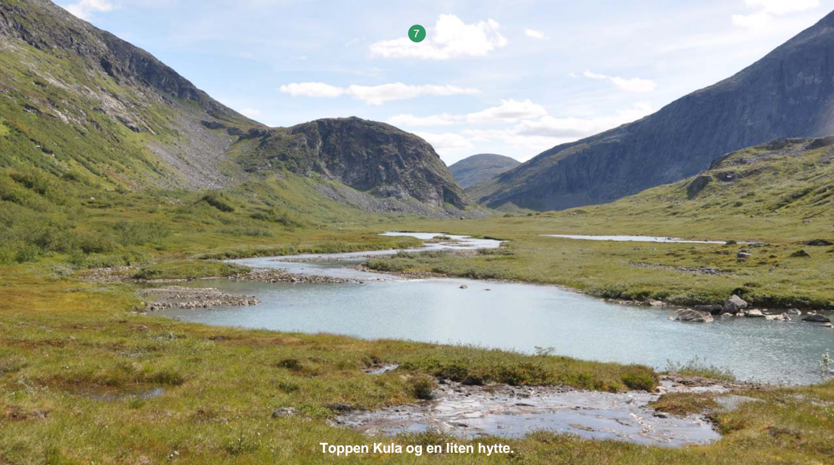
Toppen Kula og en liten hytte.