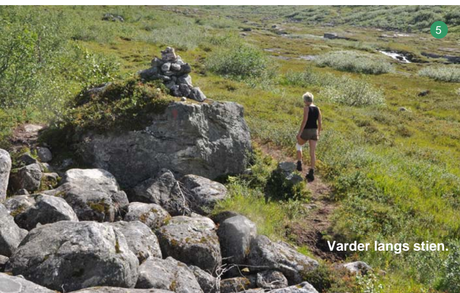
5 Varder langs stien.