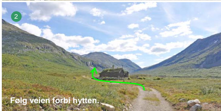
2 Følg veien forbi hytten.