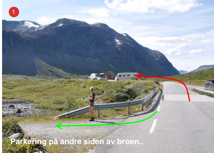
1 Parkering på andre siden av broen..