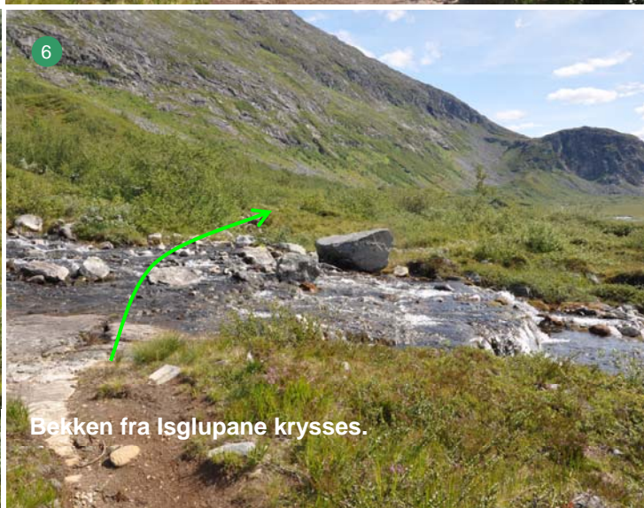
6 Bekken fra Isglupane krysses.