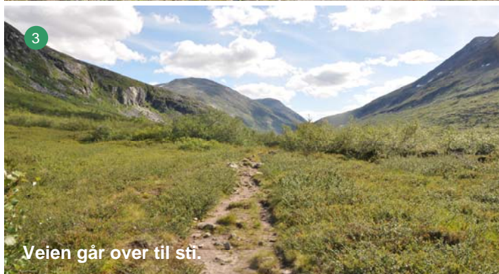
3 Veien går over til sti.